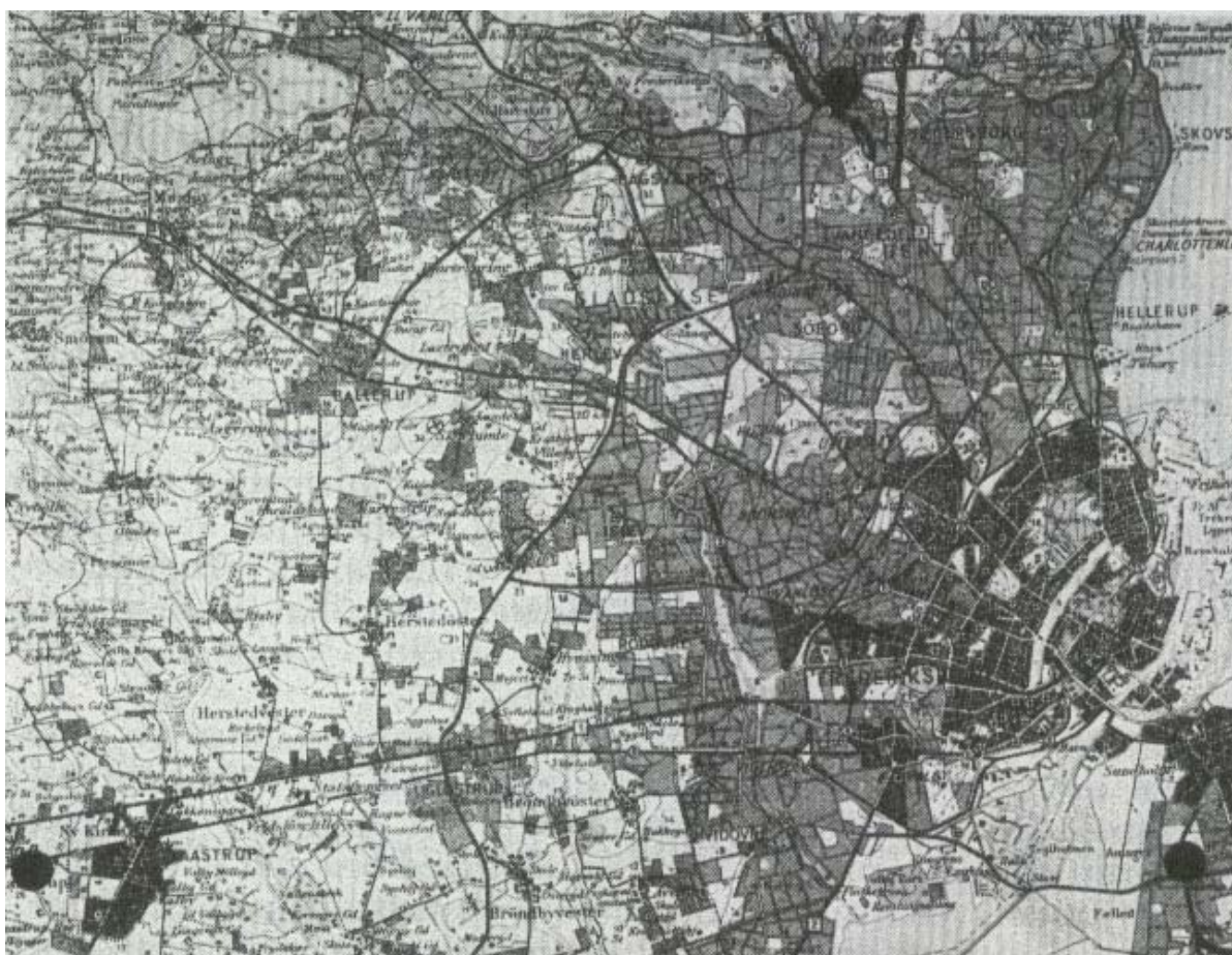
Fig. 2. Del av Stor-Köpenhamn med alternativa centrumområden markerade. Skala 1: 200 000. (Förminskning av topografisk karta i skala 1: 100 000).